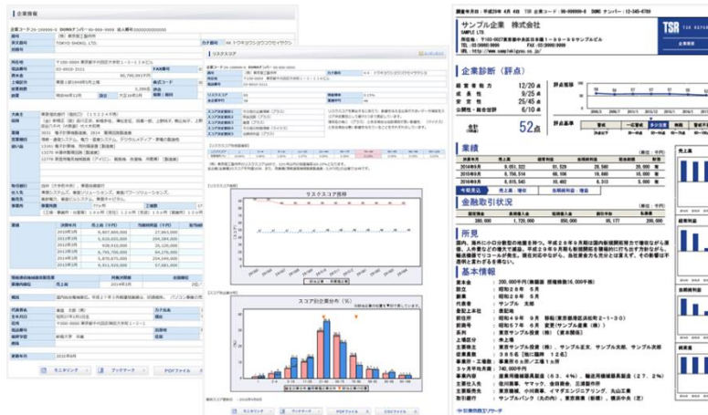
↑ 受付完了時提供の「企業概要」と「リスクスコア」

突発的に発生する企業の変化に対しては1年間随時メールでご提供いたします。TSRでは業界で唯一精度の高い倒産確率（リスクスコア）を標準サービスでご提供いたします。